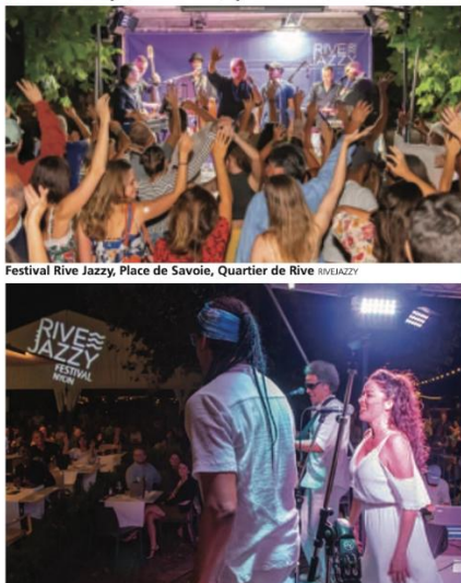
Rive Jazzy 2022, 06.08.2022, SinCraneo, O' Les Terrasses du Lac RIVEJAZZY

Tout le programme sur: https://www.rivejazzy.ch