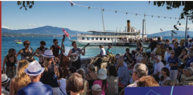
Festival Rive Jazzy, Quartier de Rive, Nyon RIVEJAZZY